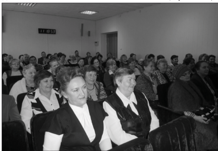
• Участники пленума.

Проводилось множество мероприятий, приуроченных к различным значимым датам (День Победы, День памяти и скорби и т.д.). Во время месячника, посвященного Дню пожилого человека, кроме прочего, прошли концерты с участием ансамбля «Глубинка». Как обычно, активно себя проявило старшее поколение на праздновании Дня поселка.