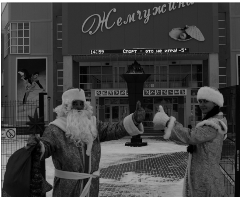
А «Жемчужинка» у вас – высший класс!