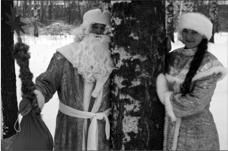
В парке – просто красота! Это – два!