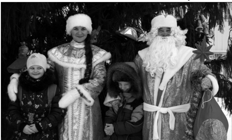
С нетерпением краса-елка