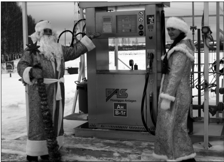
А у вас, однако, газ! Это – раз!