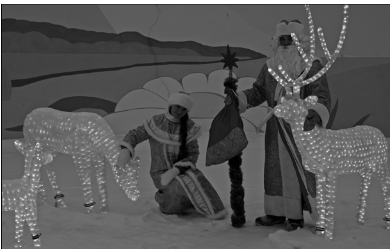
Это что еще за диво?!