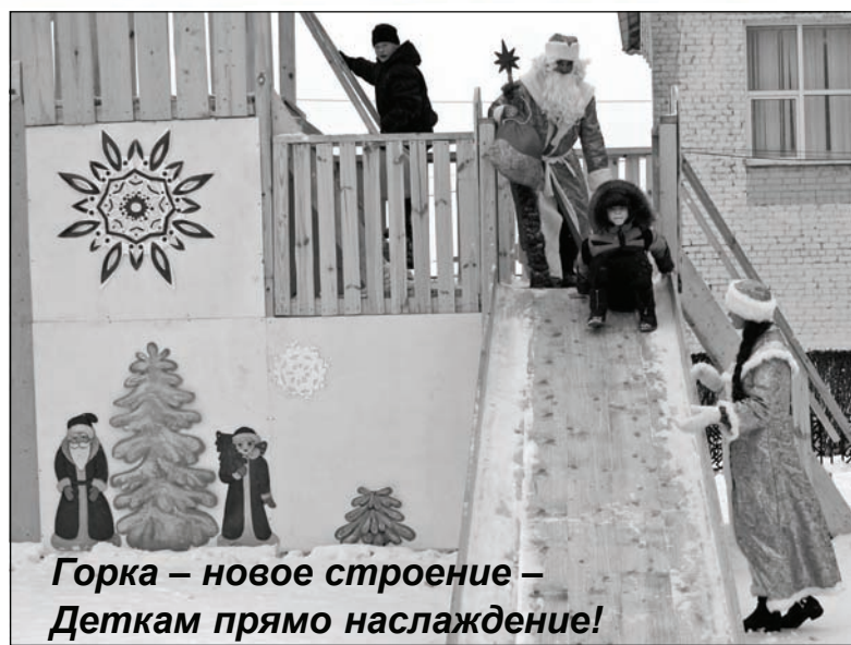
Горка – новое строение – Деткам прямо наслаждение!