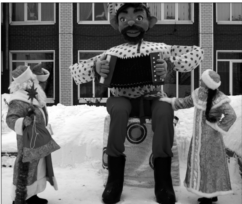
Дедушка Мороз, смотри! Вот и чудо номер три! Песни дивные поет, видно, хорошо живет...

И все эти объекты выбирались населением неслучайно, а по принципу: что для них важнее на сегодняшний день.