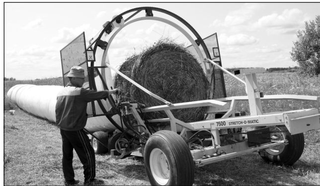
● Кормозаготовительный комплекс в ООО «Роженцово».

Актуальная тема – популяризация здорового образа жизни. В Поздеевском спорткомплексе занимаются дети, молодежь, взрослые люди. Здесь проходят различные мероприятия, организованы команды по волейболу, футболу, теннису, успешно принимающие участие в соревнованиях