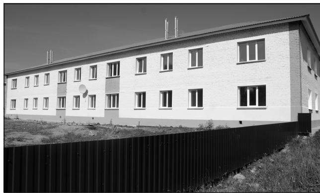
● Шестнадцатиквартирный дом для тружеников сельского хозяйства «АПК «Поздеево».