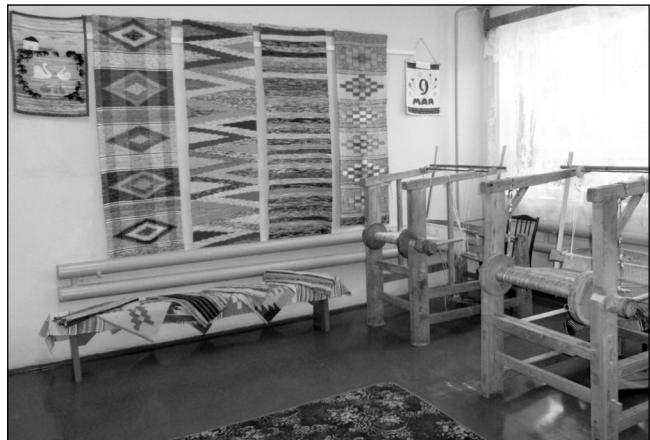
● Мастерская по ткачеству.