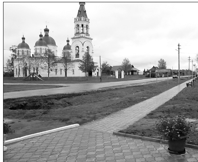
● В селе Роженцово.

разного уровня. Для создания более комфортных условий здесь выполнены надлежащие ремонтные работы (замена электропроводки, частичная – полов, покраска стен и др.)