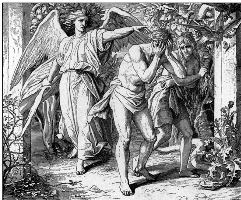
• Изгнание из Рая.

— Что с тобой? Почему ты плачешь? И чужая боль проникала в ее сердце. Вот и теперь она скло-