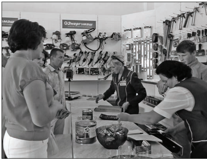
• С ассортиментом товаров «Строителя» знакомятся первые покупатели.

разный подарок, именно в преддверии Дня рождения поселка. «Торговый дом «Строитель» – объект, который будет функционировать, радовать наших жителей. Тем более, что в этой части Шаранги магазинов не так много». Появившееся торговое