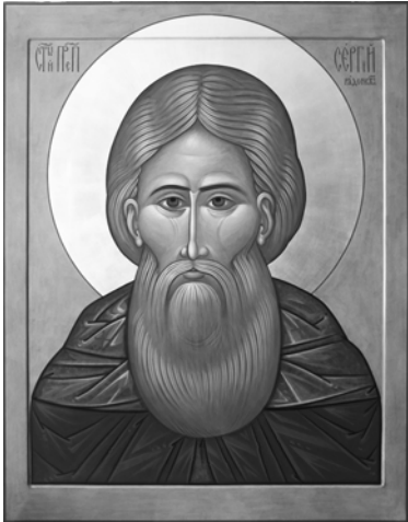
Преподобный Сергий Радонежский. (Эту икону Вы можете приобрести в магазине «Православные подарки»).

5 июля 1422 года преподобный Никон изнес нетленные мощи преподобного Сергия и положил их в специально для этого возведенном каменном Троицком соборе монастыря. Понине святые мощи преподобного Сергия являются драгоценнейшим сокровищем обители, источником благодатных исцелений душевных и телесных немощей всех молитвенно прибегающих к его заступничеству.