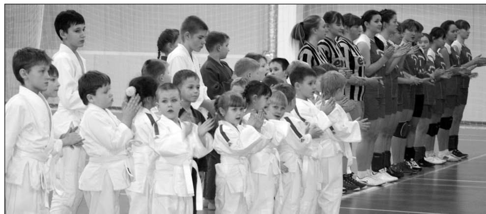
• Будущие олимпийцы?! Все может быть...

Еще совсем недавно сама идея строительства физкультурно-оздоровительного комплекса в нашем районе была чем-то эфемерным и недостижимым. Сначала шарангцы недоверчиво наблюдали за строительством ФОКа, затем с нетерпением ожидали его пуска и с радостью принимали участие в его открытии, которое благополучно свершилось накануне 2013 года.