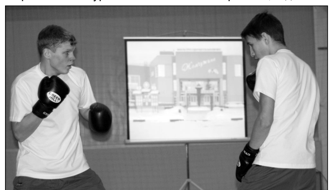
• Бокс – занятие не для слабых.

ПРОДОЛЖИЛСЯ праздник на ледовой арене, где все желающие смогли принять участие в новогодней дискотеке. Под узнаваемые и любимые хиты вместе с Дедом Морозом и Снегурочкой «зажигали» и взрослые, и дети.