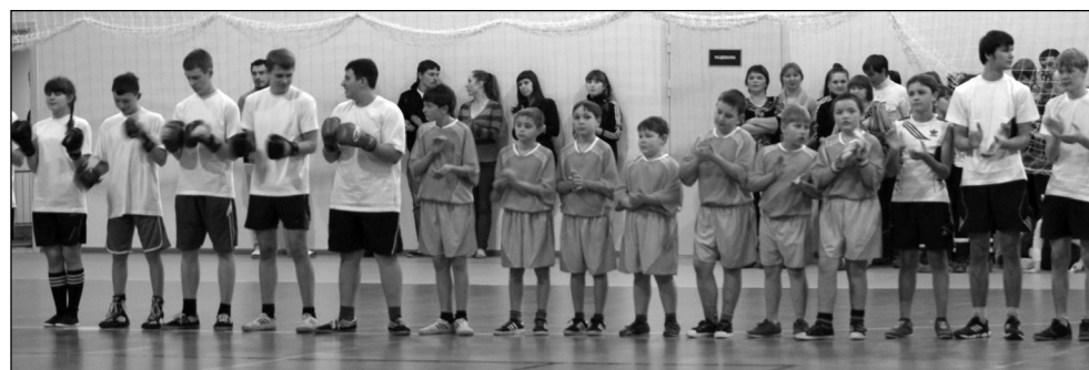
• Физкультурные резервы Шарангского района.

эрлифтинг, настольный теннис, спортивная аэробика, адаптивная физическая культура.