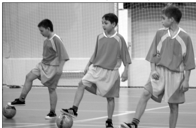
• Его Величество Футбол.