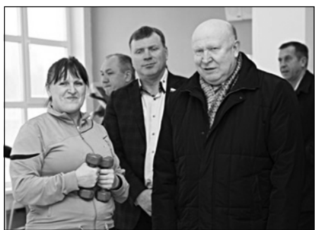
• В.П. Шанцев на открытии ФОКа «Молодежный»

Его мнение полностью совпадает со словами других корифеев спорта, посещавших ранее наши ФОКи – это и Александр Карелин, и Елена Посевина, и Светлана Хоркина. В 2011 году, в рамках своего визита в Ни-