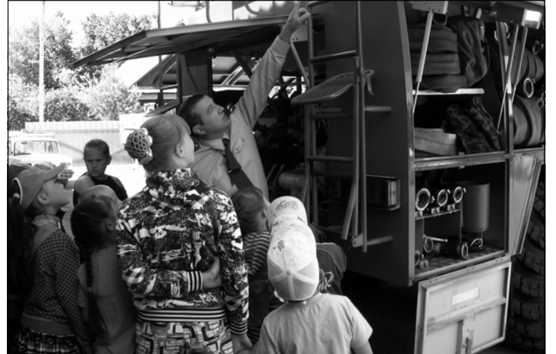
• Знакомство с пожарной техникой.

дены итоги, вручены грамоты и призы, а ребятами оставлены отзывы: «Мы здорово отдыхали в лагере. Нам очень понравилась «Спартакиада», беседы в библиотеке, подвижные игры, увлекательные путешествия в мир сказок, походы в ФОК... Очень жаль, что смена такая короткая. Всем хорошего лета!»