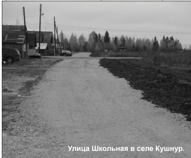
Улица Школьная в селе Кушнур.