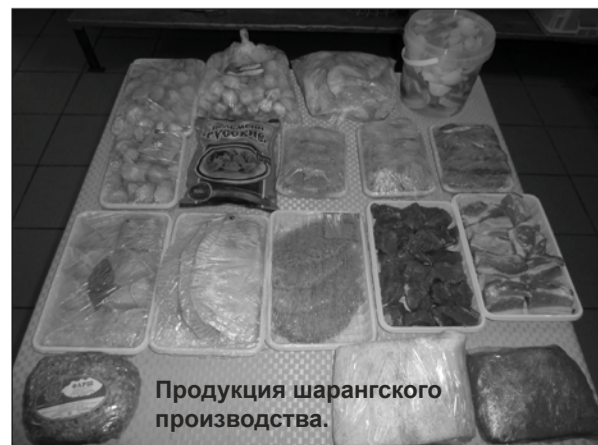
Продукция шарангского производства.