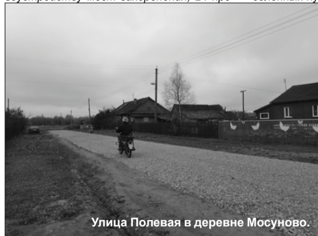
Улица Полевая в деревне Мосуново.

По мнению губернатора области Валерия Шанцева, – «главный результат программы заключается не в том, благодаря различным источникам финансирования благоустраиваются улицы, ремонтируются дороги, уличное освещение, муниципальные учреждения спорта, культуры и досуга, водопроводные сети, главное – интерес и активность, с которыми жители отнеслись к проектам! Они справедливо воспринимают их как собственные и принимают меры по сохранению своего труда». Пресс-служба губернатора и правительства НО