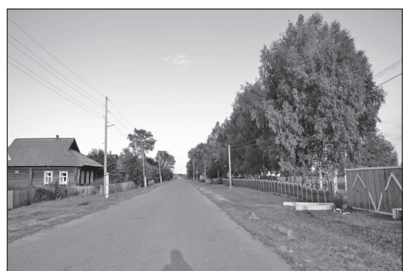
• Главная улица села.

Дошкольное образовательное учреждение – детский сад «Колосок», в котором функционирует разновозрастная группа с наполняемостью 15 человек. Коллектив