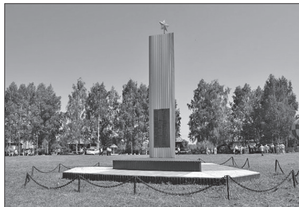
• Памятник воинам-землякам.