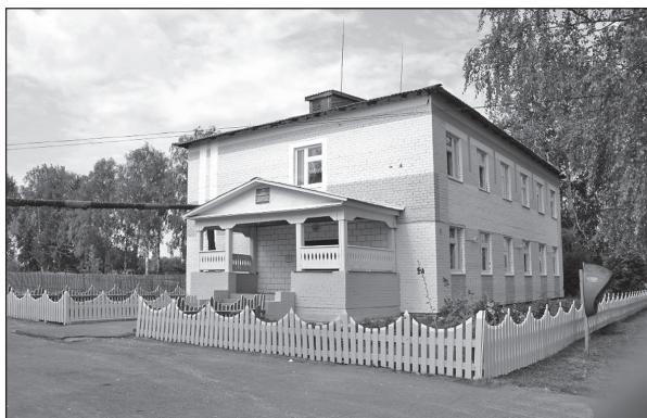
• Школа в селе Щенники.

состоит из 9 сотрудников. Приоритетным в работе с детьми специалисты выбрали для себя экологическое воспитание.