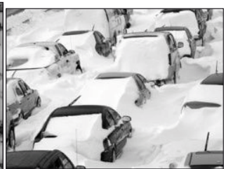
Дома до крыш занесены. На деревьях – снега шапки... Даже технике – не сладко!